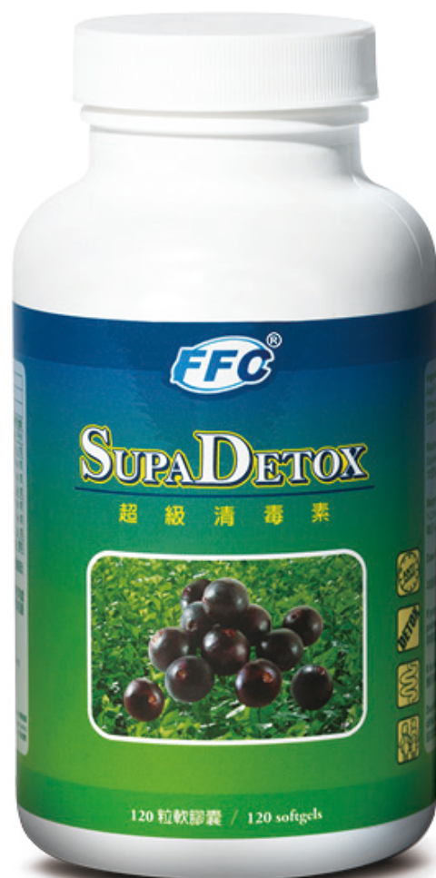
120 粒軟膠囊 (另有 30 粒裝)

* 此產品沒有根據《藥劑業及毒藥條例》或《中醫藥條例》註冊。為此產品作出的任何聲稱亦沒有為進行該等註冊而接受評核。此產品並不供作診斷，治療或預防任何疾病之用。