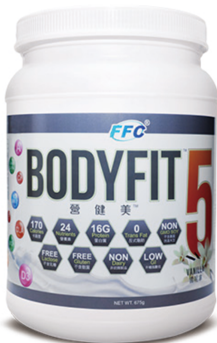
淨重 675 克