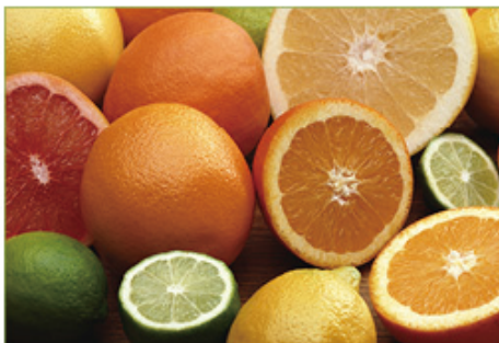
維生素 C (抗壞血酸鈣)