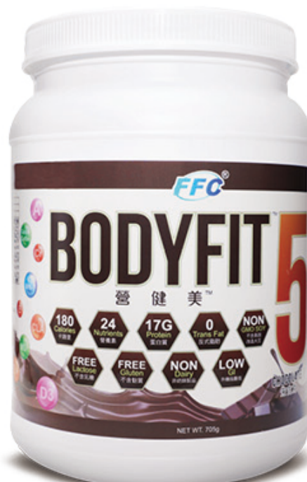
淨重 705 克

* 此產品沒有根據《藥劑業及毒藥條例》或《中醫藥條例》註冊。為此產品作出的任何聲稱亦沒有為進行該等註冊而接受評核。此產品並不供作診斷，治療或預防任何疾病之用。